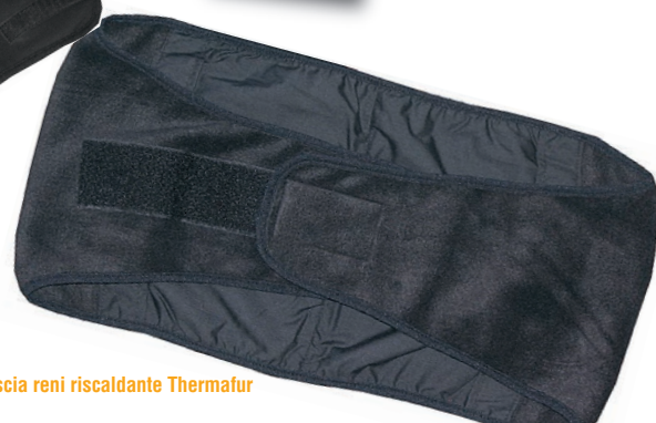
Fascia reni riscaldante Thermafur